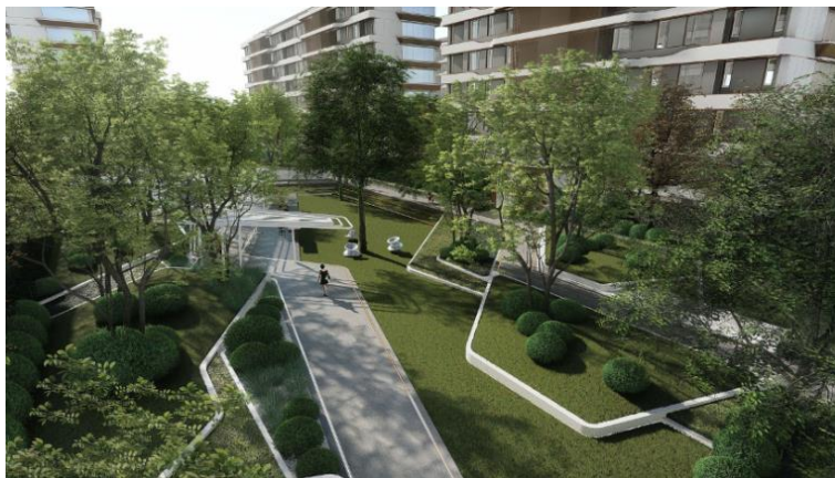
图：元江路 TOD 租赁住房效果图

据申通地铁集团介绍，位于闵行区颛桥镇、毗邻“大零号湾”的元江路 TOD 上盖正在全力建设，元江路保利光合上城一期正在加速建设阶段。预计自 2025 年起，这里将会逐渐呈现出一座集住宅、商业、办公、公寓、公园于一体的地铁上盖综合体。光合上城将致力于打造全国标杆租赁社区，预计 2026 年一季度正式入市，将提供约 3000 套租赁住房。项目涵盖高层白领公寓及低密轻奢公寓两个不同租赁组团，满足不同客户的租赁需求。在主力户型设计上，充分考虑了年轻人的租住习惯，打造性价比高的、功能齐全的、装修品质好的约 30 平方米整租精品。除此之外，光合上城还将提供约 1200 平方米的超大公共区域，不仅有接待会客、影音休闲、健身房等基础功能，还会重点打造自习室、直播间、宠物友好等特色空间功能，让租客居住时可以感受到丰富、有趣、好用的社区配套氛围。