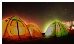
沙漠露营/篝火晚会