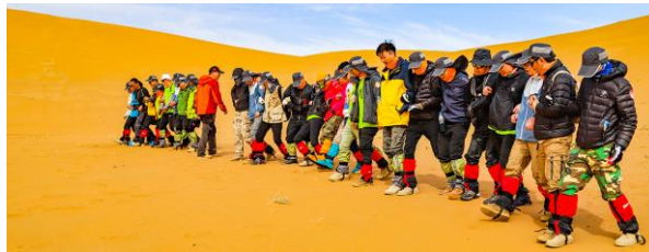
沙漠运动 团队配合