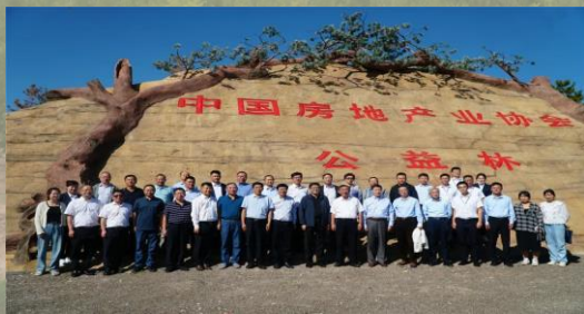
2022年公益林建设活动合影