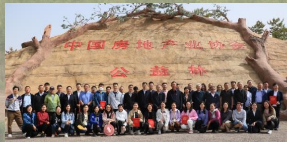
2023年公益林建设活动合影