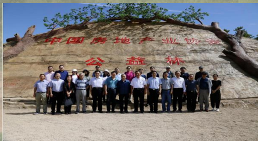
2021年公益林建设活动合影

当前，我国经济社会发展已进入加快绿色化、低碳化的高质量发展阶段，房地产行业正面临深度调整和加速转型，上下游制造企业急需绿色科技创新和生态建设。为此，中国房地产业协会计划于2024年公益林建设活动同期，举办沙漠徒步精英挑战赛活动，带领会员单位践行生态保护行动，号召绿色生产生活方式，构建房地产产业链生态发展新模式，推进行业绿色低碳发展。同时为宁夏沙漠绿化与沙产业发展基金会探索建立可持续的循环经济模式。