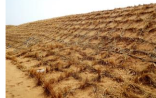
治沙体验 -扎麦草方格